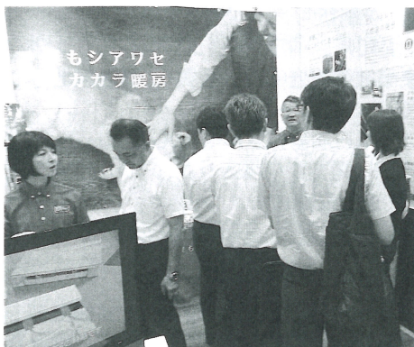
(左)リボンガス展示ブース

FHSは、8月3日13時から熊本市のリボンガス(株)研修室で「温水床暖房普及プロジェクト・導入研修」を行う。内容は温水床暖房市場の現状や販売・設計・施工に関する解説、施工現場見学等。申込みはリボンガス(TEL.096-273-7446)で受付けている。